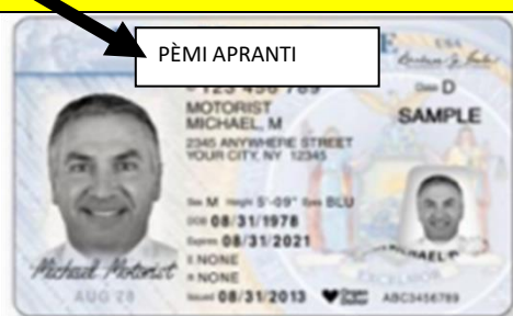
Pèmi Apranti ki gen Plis Pase 21 Ane

Si ou kondi poukont ou avèk yon pèmi, se yon vyolasyon Lwa Eta New York konsènan Veyikil ak Sikilasyon Machin.