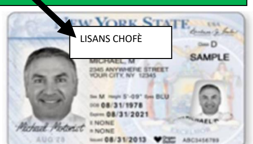
Lisans Chofè ki gen Plis Pase 21

OU TE PASE TÈS KONDI SOU WOUT EPI OU KAPAB KONDI SAN SIPÈVIZYON (Si lajistis kondane ou pou sèten vyolasyon sikilasyon machin nan 6 mwa apre ou resevwa lisans ou, ou kapab gen lisans ou pou kondi sispann oswa revoke pou yon peryòd tan.)